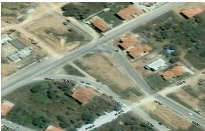
εικόνα 1. Αεροφωτογραφία Κ.Χ- Χώρου Πάρκου

Ο εξοπλισμός αυτός θα τοποθετηθεί σε κοινόχρηστο χώρο του Δήμου χαρακτηρισμένο ως «χώρος πάρκου» συνολικής έκτασης 1.778,25τ.μ. στη συμβολή των οδών Σεφέρη, Καραμανλή, Ελύτη και Ασκληπιού (εικόνες 1, 2 & 3).