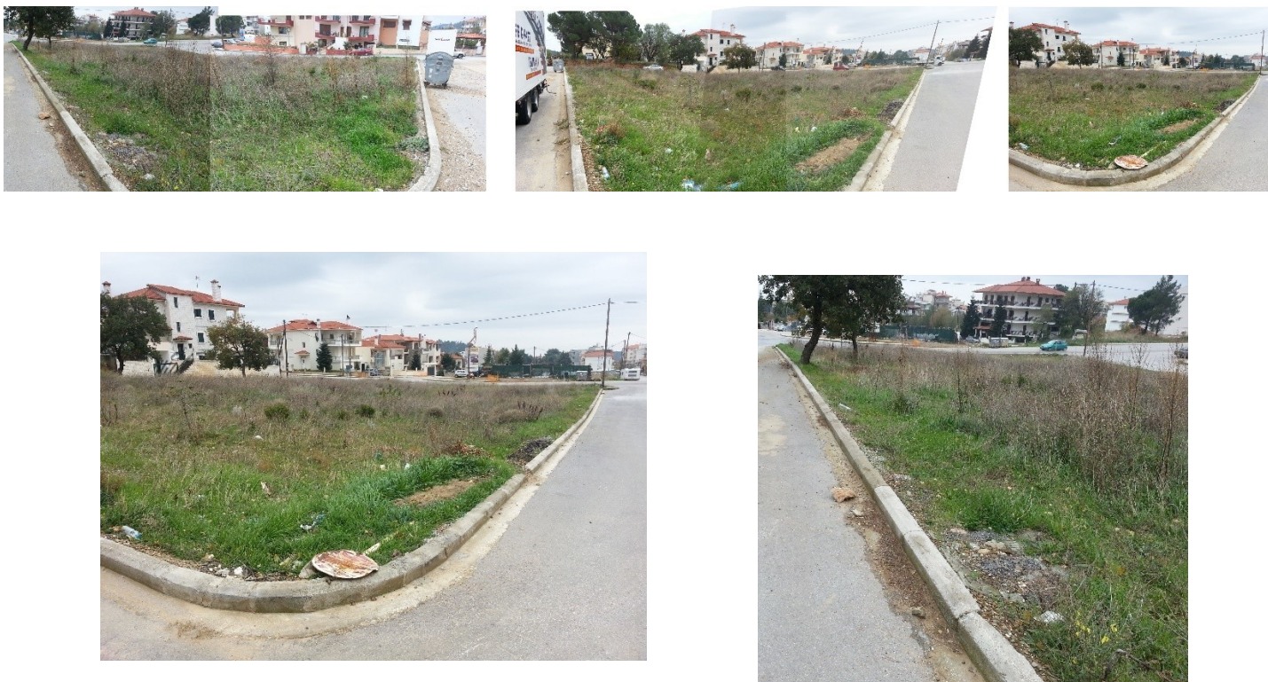
εικόνα 3. Φωτογραφική αποτύπωση υπάρχουσας κατάστασης Κ.Χ- Χώρου πάρκου